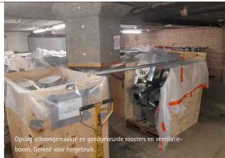
Opslag schoongemaakte en goedgekeurde roosters en ventilatieboxen. Gereed voor hergebruik.