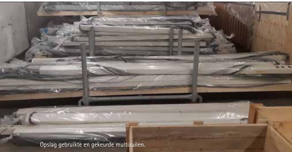
Opslag gebruikte en gekeurde multizulen.