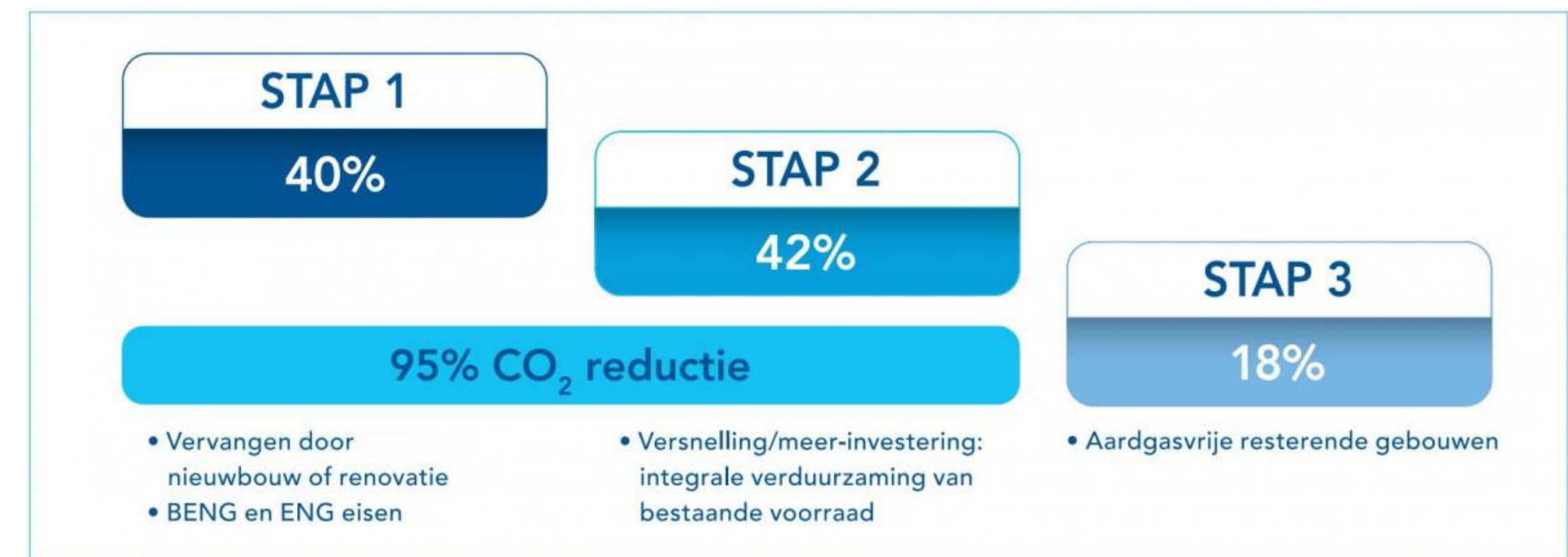
Sectorale routekaart VNG