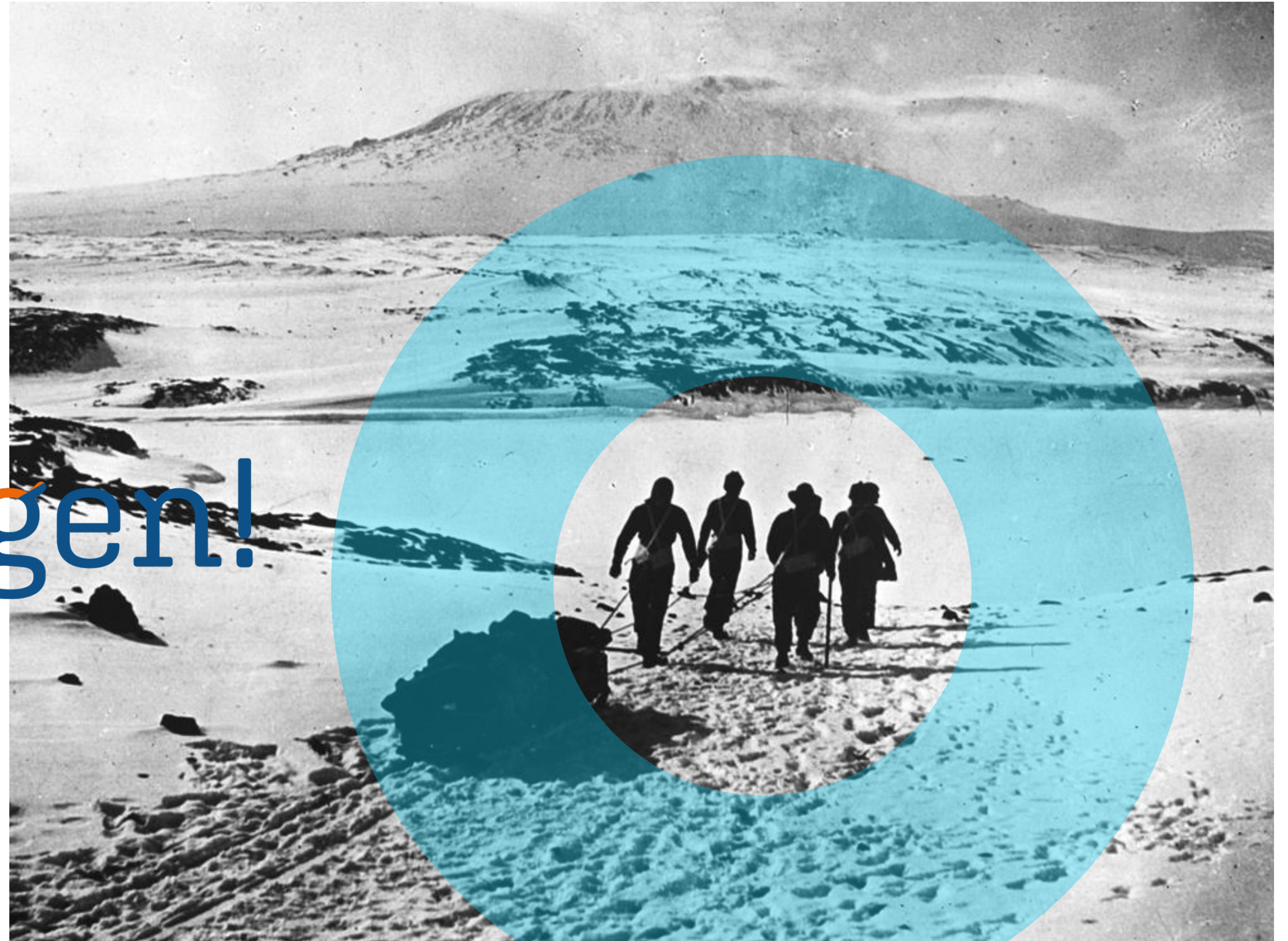
1901 – 1E OFFICIËLE BRITSE VERKENNING VAN ANTARCTICA

Adviseurs voor toekomstbestendige én duurzame gebouwen en gebieden.